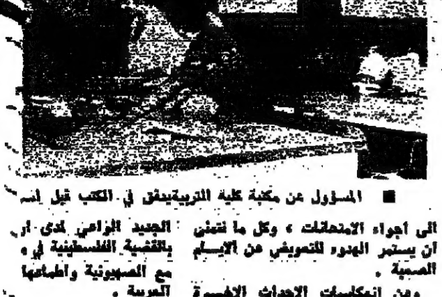
المسؤول عن مكتبة كلية التربية يفتش في الكتب قبل اصدار

الجيد الزامي لدى ار ، بالثقافة الفلسطينية في مع الصهيونية واطمئنان العربية . مصالحة عائلتي الحاج حسن وزه في المجلس الشيبا . يحل بعد ظهر اليوم من المجلس الاسلامي الى بمصالحة عائلتي الحاج . ويظهر ان يكون ها بملامها مصالحتك تشال ، الخاصة في منطقة بعلب والمزور في البلاد بين يعود الى ١٨ عابا ، من ٢٢ قتيلا من الفر ومن المقرر ان ياتي السيد موسى السيد حفي ، والاضحية وحقائق الحقبة عن الارضاع الوارثة ا البلاد .